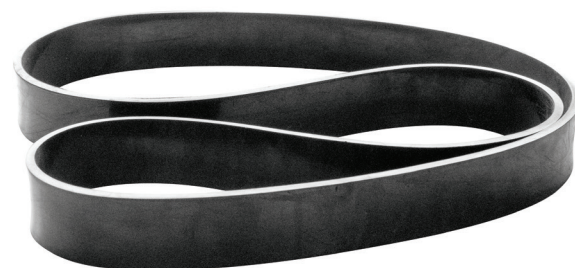
SANGLE ELASTIQUE DE REBOND