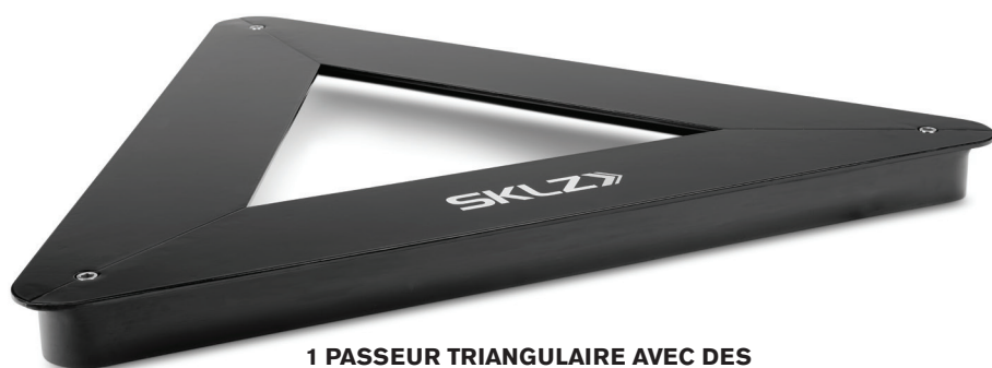
1 PASSEUR TRIANGULAIRE AVEC DES