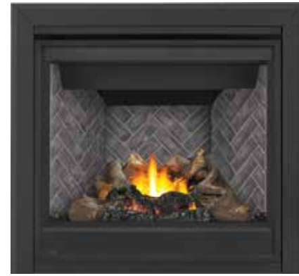
Moulure cambrée de luxe de 3 po