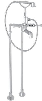
Palladian® Floor Mount Tub Filler