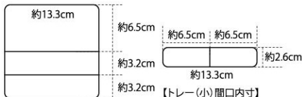
【トレー(大)間口内寸】