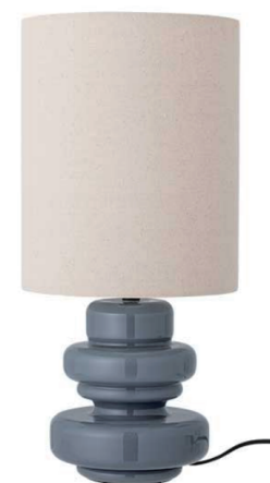
TABLE LAMP 82054160

ENGLISH - IMPORTANT INFORMATION Please read the entire manual before using this product. Follow the manual thoroughly and keep it for future reference. Always shut off power to the circuit before starting installation work. For indoor use only. DEUTSCH - WICHTIGE INFORMATIONEN Bitte lesen Sie das gesamte Handbuch, bevor Sie dieses Produkt verwenden. Befolgen Sie die Anweisungen im Handbuch gründlich und bewahren Sie dieses zum späteren Nachschlagen auf. Schalten Sie die Stromversorgung vor der Inbetriebnahme immer aus. Nur für den Innenbereich. FRANÇAIS - UNE INFORMATION IMPORTANTE S' il vous plaît lire le manuel entier avant de commencer à utiliser ce produit. Suivez le mode d'emploi et le conserver pour référence future. Toujours couper l'alimentation au panneau principal avant de procéder à l'installation. Pour un usage intérieur uniquement. NEDERLANDS - BELANGRIJKE GEGEVENS Lees de hele handleiding voordat u dit product te gebruiken. Volg de handleiding grondig door en bewaar deze voor toekomstige gebruik. Schakel de stroom altijd uit voordat met de installatie wordt begonnen. Uitsluitend voor gebruik binnenshuis.