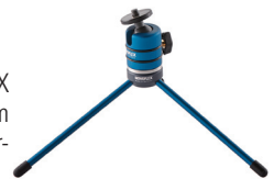
NOVOFLEX BALL 19

In Verbindung mit einem Kugelkopf wie dem NOVOFLEX BALL 19 oder dem NOVOFLEX NEIGER 19 wird das Ministativ noch flexibler und ist für alle Fälle gerüstet. Mit dem NOVOFLEX BALL 19P oder NEIGER 19P steht sogar noch eine Panoramafunktion zur Verfügung.