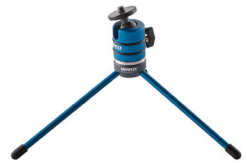
NOVOfLEX BALL 19

Along with a Ballhead like NOVOfLEX BALL 19 or NOVOfLEX NEIGER 19 MICROPOD becomes even more flexible and is the right appliance for every situation. In combination with NOVOfLEX BALL 19P or NEIGER 19P even a panorama panning function is available.