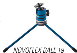
NOVOFLEX BALL 19

In Verbindung mit einem Kugelkopf wie dem NOVOFLEX BALL 19 oder dem NOVOFLEX NEIGER 19 wird das Ministativ noch flexibler und ist für alle Fälle gerüstet. Mit dem NOVOFLEX BALL 19P oder NEIGER 19P steht sogar noch eine Panoramafunktion zur Verfügung.