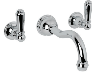
Robinet de lavabo mural avec bec à colonne