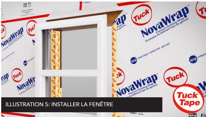
ILLUSTRATION 5: INSTALLER LA FENÊTRE

Installez la fenêtre conformément aux instructions du fabricant. Voir illustration 5. Note: La fenêtre doit être installée et fixée avant l'installation du ruban pour solin sur les montants (étape 6). NE PAS COMMENCER L'ÉTAPE 6 AVANT QUE LA FENÊTRE NE SOIT PROPREMENT FIXÉE, selon les instructions du fabricant.