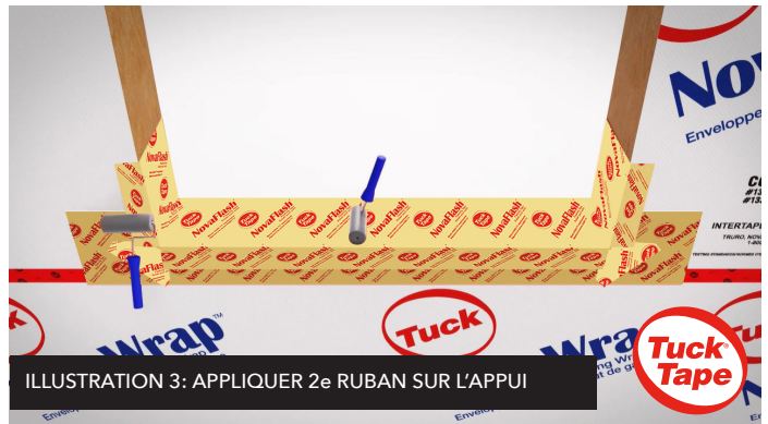
ILLUSTRATION 3: APPLIQUER 2e RUBAN SUR L'APPUI

À la manière des bardeaux de toit, appliquez du NovaFlash à l'intérieur de l'appui de fenêtre en laissant 6-pouces de ruban sur les montants, de chaque côté. En alignement avec le rebord intérieur du seuil de fenêtre, repliez le ruban sur la face extérieure du mur. Voir illustration 3.