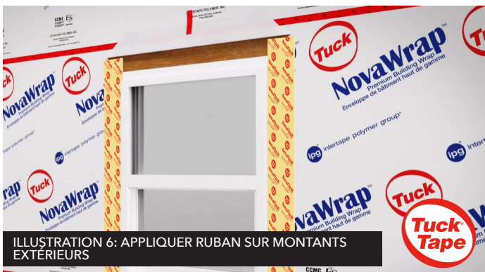
ILLUSTRATION 6: APPLIQUER RUBAN SUR MONTANTS EXTÉRIEURS

Une fois la fenêtre installée, appliquez des bandes de ruban verticalement sur la face extérieure de chaque montant, en vous assurant de chevaucher le cadre de fenêtre d'un pouce. Voir illustration 6.