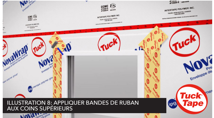
ILLUSTRATION 8: APPLIQUER BANDES DE RUBAN AUX COINS SUPÉRIEURS

Rabaissez le rabat de pare-Air du haut et appliquez des morceaux de NovaFlash sur les coupes diagonales. Voir illustration 8.