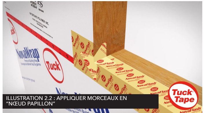
ILLUSTRATION 2.2 : APPLIQUER MORCEAUX EN "NŒUD PAPILLON"