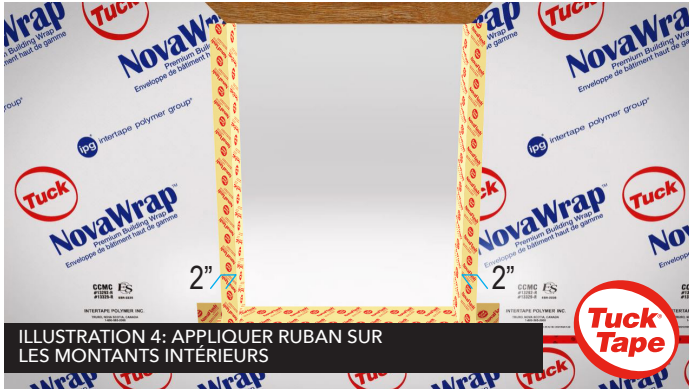
ILLUSTRATION 4: APPLIQUER RUBAN SUR LES MONTANTS INTÉRIEURS

Appliquez une bande de NovaFlash verticalement à l'intérieur des deux montants à pleine hauteur de l'ouverture, tout en repliant au moins 2-pouces sur la face extérieure du mur, par-dessus le Pare-Air Novawrap. Voir illustration 4.