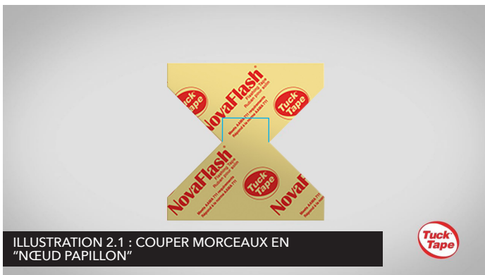
ILLUSTRATION 2.1 : COUPER MORCEAUX EN "NŒUD PAPILLON"

Pour une protection complète des coins inférieurs de l'ouverture, préparez deux morceaux de ruban NovaFlash en forme de "noeud papillon". Coupez un carré de ruban de 4-pouces sur 4-pouces, pliez-le en deux et faites des coupes diagonales de moins de 45 degrés de chaque côté, en vous assurant de laisser un pouce et demi au centre du « noeud papillon ». Appliquez une extrémité du "noeud papillon" sur le coin inférieur de du seuil de fenêtre et appliquez l'autre extrémité sur la face extérieure du mur en prévoyant un chevauchement d'au moins 2 pouces. Appliquez une pression en utilisant le rouleau en J. Voir illustration 2.