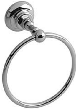
Anneau à serviette RO7