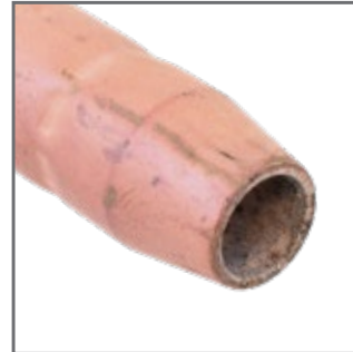
BUSES PRÉ-ENDUITES E-WELD MC