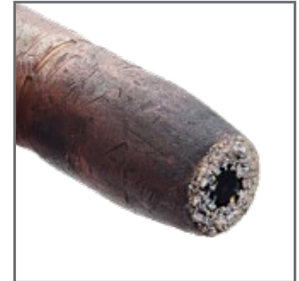
BUSE RÉGULIÈRE OEM COMPLÈTEMENT BOUCHÉE