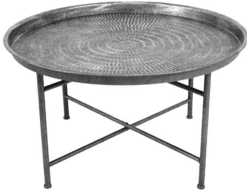
Side 2 / Côté 2 / Dispositivo 2