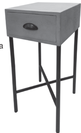
Assembled Table Table assemblée Mesa ensamblada

Nos complace ayudar con cualquier pregunta o comentario sobre su producto. No dude en contactarse con nosotros en customerservice@uniekinc.com