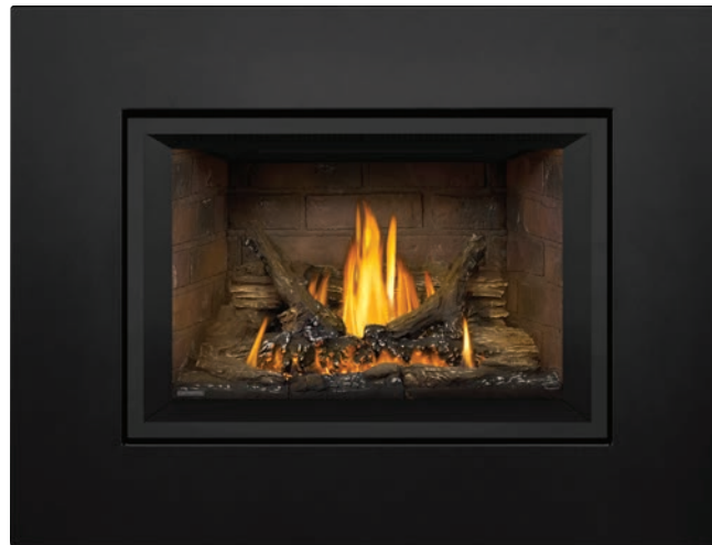
Grande plaque de fond à 4 côtés