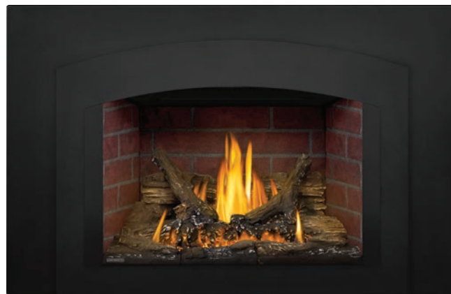
Petite façade arquée à 4 côtés

Également offerts : Petites façades à 3 et à 4 côtés Grandes façades à 3 et à 4 côtés Petite plaque de fond à 3 côtés Plaque de fond moyenne à 3 côtés Grande plaque de fond à 3 côtés