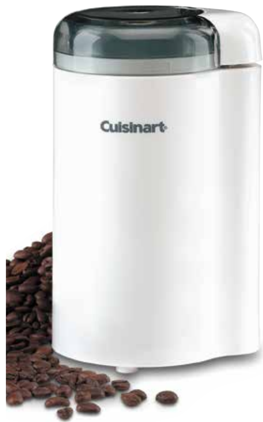
Molinillo de café Coffee Bar™ Serie DCG-20

Para su seguridad y para disfrutar plenamente de este producto, siempre lea las instrucciones cuidadosamente antes de usarlo.