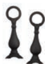
Bornes de chenet noires