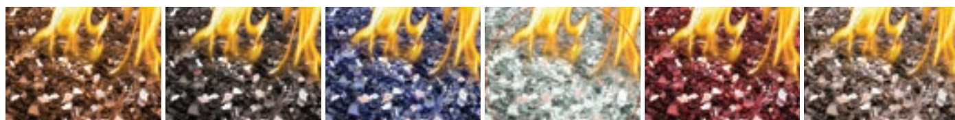
Braises de verre : ambre, noir, bleu, clair, rouge, topaze

Ensembles d'éléments décoratifs optionnels :