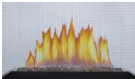
Braises de verre

Options de brûleur (vous devez en choisir un) :