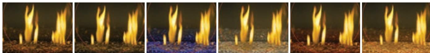
Billes de verre : ambre, noir, bleu, clair, rouge, topaze