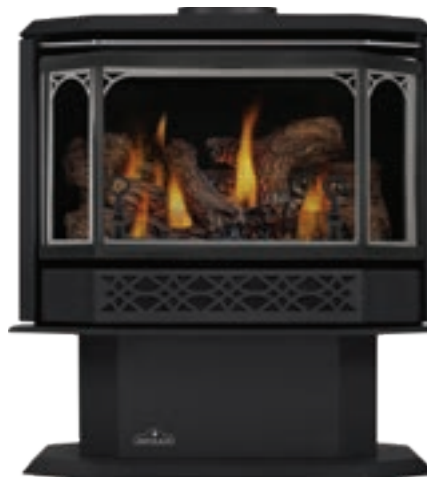
Plaqué chrome satiné