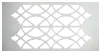
Plaqué chrome satiné