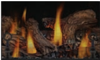
Ensemble de bûches PHAZER