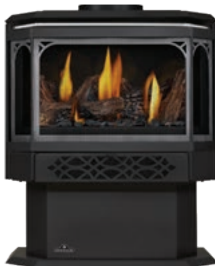
Plaqué chrome satiné