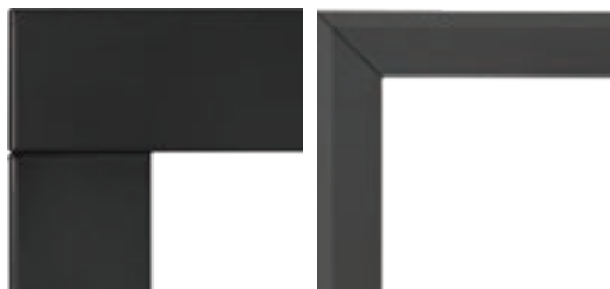
Moulure noire de 3 po