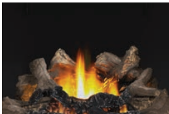
Ensemble de bûches de chêne