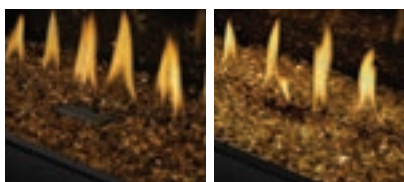
Braises de verre