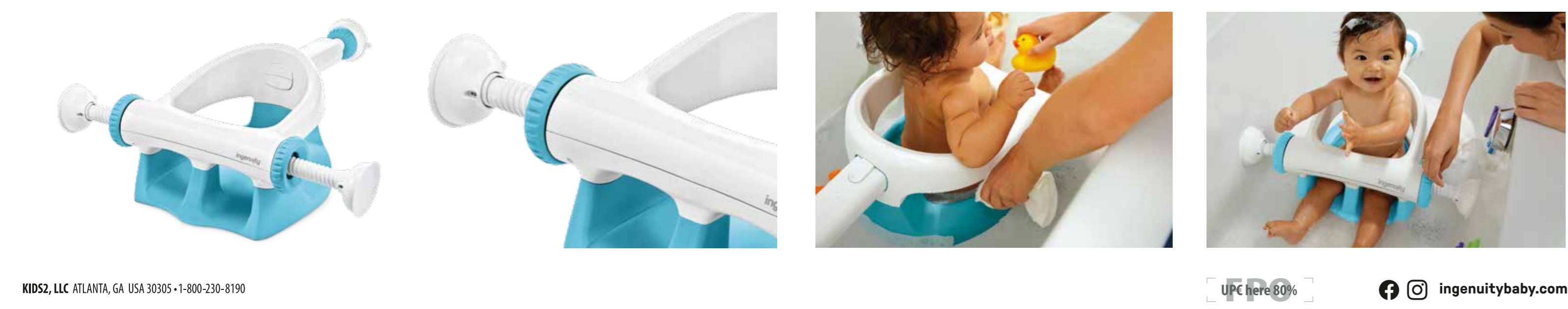
Accommodates standard rectangular tubs 21"-24" wide Se adapta a bañeras rectangulares estándar de 53 a 61 cm de ancho S'installe dans les baignoires standard rectangulaires de 53 à 61 cm de large Sure & Secure™ suction cups Ventosas Sure & Secure™ Ventouses Sure & Secure™ High backrest provides comfort & support Respaldo alto que proporciona comodidad y apoyo Dossier haut pour plus de confort et de soutien ingenuitybaby.com