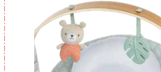
Removable wood toybar with 2 removable toys Barra de juguetes de madera desmontable con 2 juguetes removibles Arc d'activités en bois amovible avec 2 jouets amovibles

Ultra cozy seat with premium materials Asiento ultra acogedor con materiales de primera calidad Siège ultra confortable en matériaux de qualité optimale