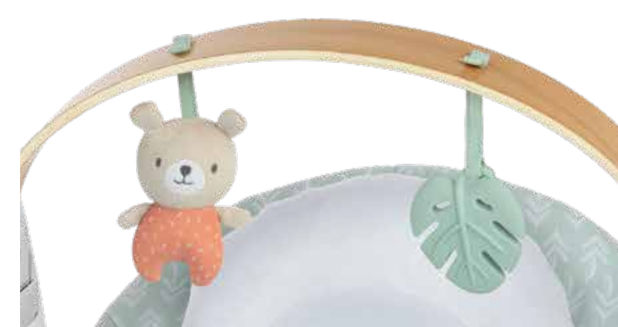
Removable wood toybar with 2 removable toys Barra de juguetes de madera desmontable con 2 juguetes removibles Arc d'activités en bois amovible avec 2 jouets amovibles