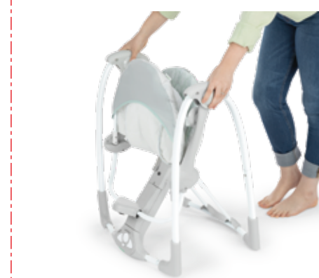
SlimFold™ design for easy storage and travel Diseño SlimFold™ para facilitar el almacenamiento y los viajes Conception SlimFold™ pour un rangement et un voyage faciles