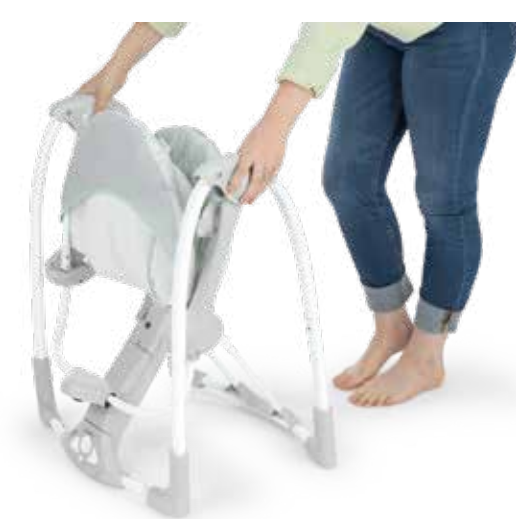
SlimFold™ design for easy storage and travel Diseño SlimFold™ para facilitar el almacenamiento y los viajes Conception SlimFold™ pour un rangement et un voyage faciles

Ultra cozy seat with premium materials Asiento ultra acogedor con materiales de primera calidad Siège ultra confortable en matériaux de qualité optimale