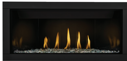
Ascent™ linéaire de luxe