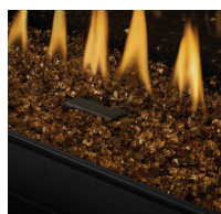
Braises de verre