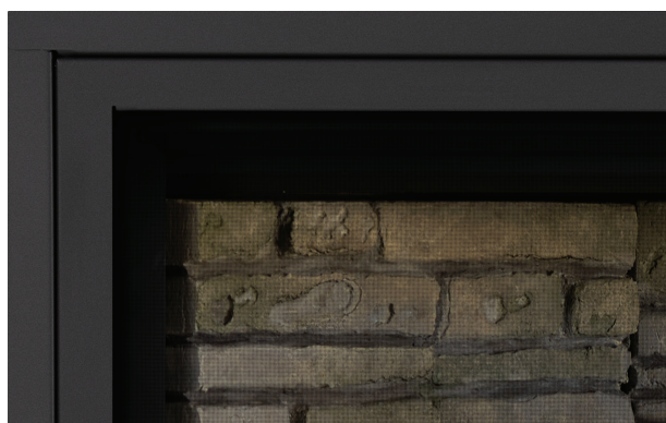
Moulure de finition ajustable à 4 côtés de 5/8 po pour les installations qui nécessitent un plus grand recouvrement