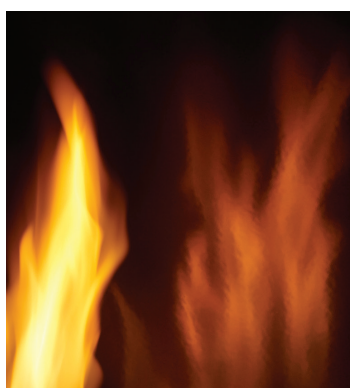
Panneaux réflecteurs radiants en porcelaine MIRO-FLAMME™