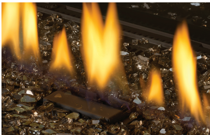
Inclus : verre concassé topaze