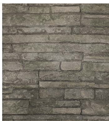
Panneaux de briques Ledgestone