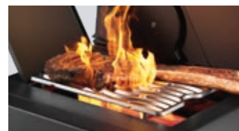
Brûleur latéral infrarouge SIZZLE ZONE™