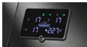
Connectivité Wi-Fi et Bluetooth®, écran ACL