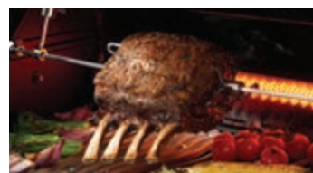
Brûleur arrière infrarouge avec ensemble de rôtissoire robuste inclus