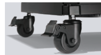
Roulettes pivotantes avec système de mise à niveau à 2 points