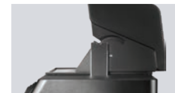
Couvercle équilibré de convection LIFT EASE™