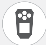
ALTAIR io 4