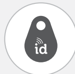
Étiquette d'identification de MSA