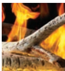
Bûches de bouleau