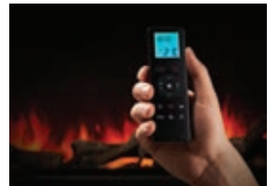
Télécommande de luxe avec affichage numérique

Il est possible de connecter votre téléphone pour contrôler facilement et aisément toutes les fonctions du foyer depuis n'importe où, même lorsque vous n'êtes pas à la maison.