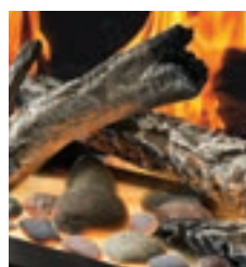
Ensemble Mineral Rock