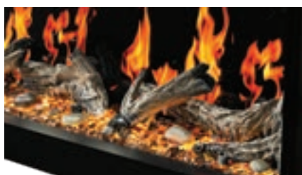
Bûches de bois flotté et ensemble Woodland