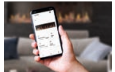
Contrôlez votre foyer avec l'application Napoleon Home, Google Home et les appareils compatibles avec Alexa.