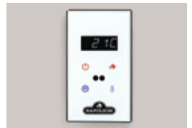
Commande murale en option avec façade noire et blanche