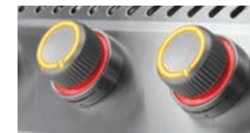
Boutons de commande à technologie SmartGlow MD