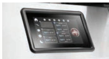
Mode intelligent avec contrôle automatisé du gaz