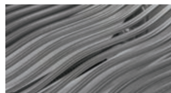
Grilles de cuisson WAVE MD emblématiques en acier inoxydable de 9,5 mm