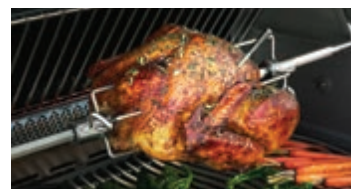
Brûleur arrière infrarouge avec ensemble de rôtissoire robuste inclus