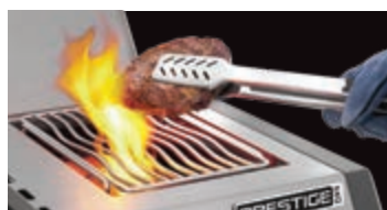
Brûleur latéral infrarouge SIZZLE ZONE MD