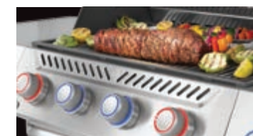
Éclairage à DEL guidé