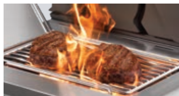
Brûleur latéral infrarouge SIZZLE ZONE™