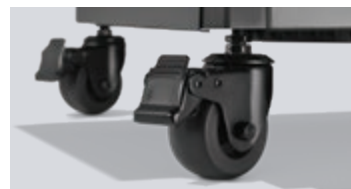
Roulettes pivotantes avec système de mise à niveau à 2 points