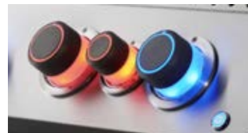
Boutons de commande SafetyGlow™