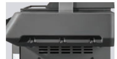
Crochets à ustensiles dissimulés intégrés