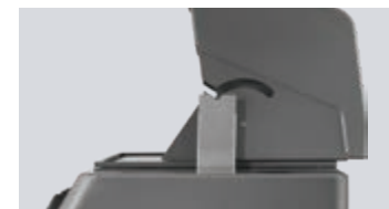
Couvercle équilibré de convection LIFT EASE™