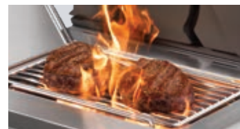
Brûleur latéral infrarouge SIZZLE ZONE™