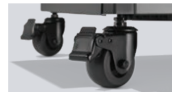
Roulettes pivotantes avec système de mise à niveau à 2 points