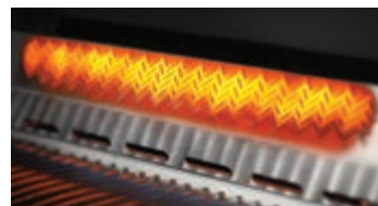
Brûleur arrière infrarouge avec ensemble de rôtissoire robuste inclus