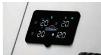
Connectivité Wi-Fi et Bluetooth®, écran ACL