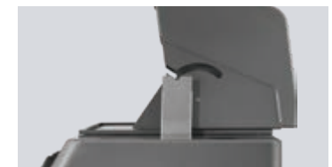
Couvercle équilibré de convection LIFT EASE™