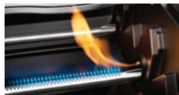
Allumage instantané sans piles JETFIRE™ 2.0