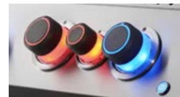
Boutons de commande SafetyGlow™