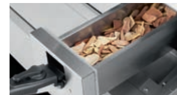
Boîtier à copeaux de bois électrique intégré