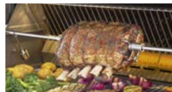
Brûleur arrière infrarouge avec ensemble de rôtissoire robuste inclus