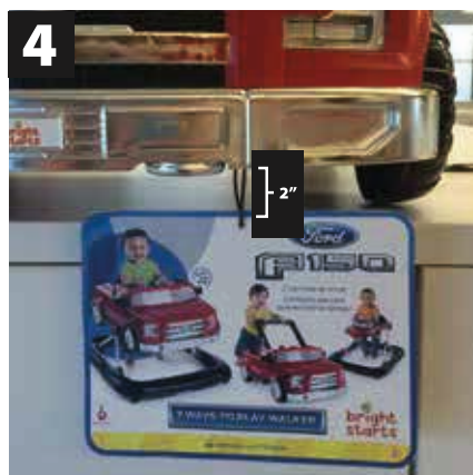
4 Finished Attachment Detail NOTE: POP hangs down 2 inches below bumper.