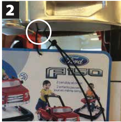
2 Thread front of cord through POP hole from the front. tie a knot. Make sure POP hangs down 2" from bumper MAKE SURE ENGLISH/FRENCH SIDE IS FACING OUT!