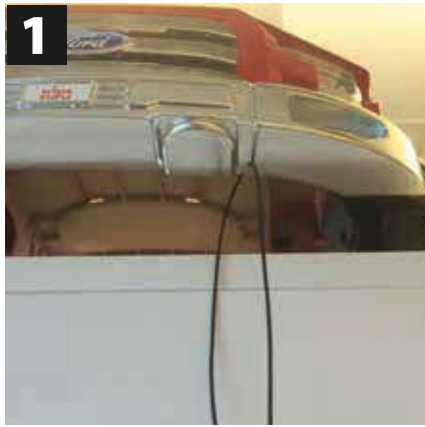
1 Use 1 17" White Elastic Cords Thread through hole in POP as shown.