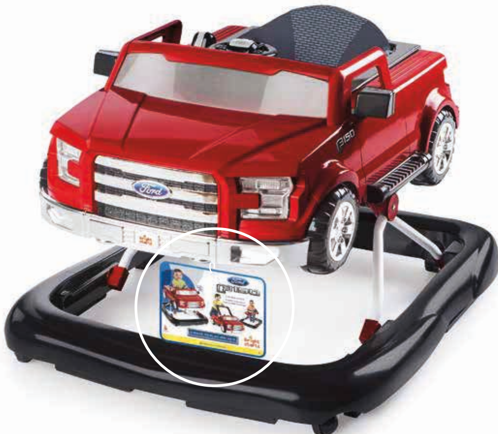
Finished Attachment (MAKE SURE ENGLISH/FRENCH SIDE IS FACING OUT!)