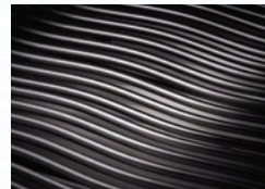
Grilles de cuisson WAVE™ emblématiques en acier inoxydable de 9,5 mm