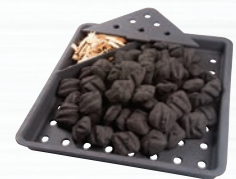
BAC À CHARBON DE BOIS / FUMAISSON EN FONTE #67732