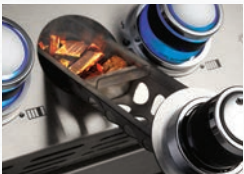
Plateau à copeaux de bois intégré