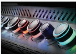
Boutons de commande NIGHT LIGHT™ à DEL en couleurs avec fonction SafetyGlow™