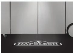
ÉCLAIRAGE DE PROXIMITÉ qui projette le logo Napoleon