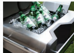
Bac à glace/marinades intégré