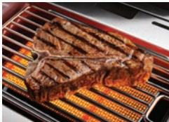
Brûleur latéral infrarouge SIZZLE ZONE™