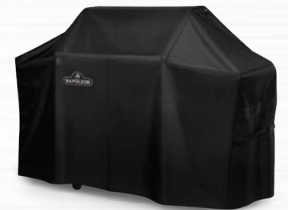
HOUSSE AJUSTÉE DE LUXE #61665