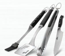
ENSEMBLE DE QUATRE USTENSILES DE CHEF EN ACIER INOXYDABLE #70037