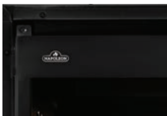
Rebord de finition sans cadre pour des installations épurées et flexibles