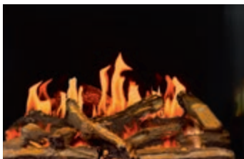
Gaz avec panneaux réflecteurs MIRO-FLAMME