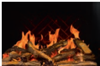
Bois avec panneaux simili-briques victoriens gris