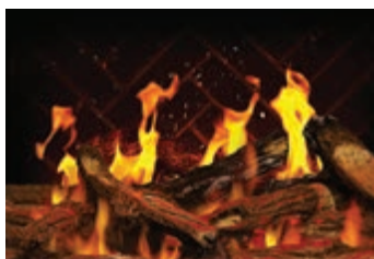
Bûches de chêne rougeoyantes de luxe