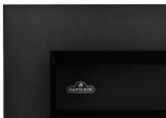
Moulure ajustable qui permet d'adapter le foyer à différentes épaisseurs de matériaux de finition