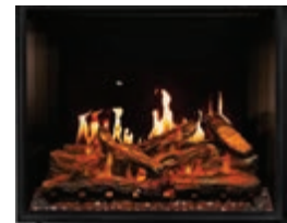
Elevation X électrique