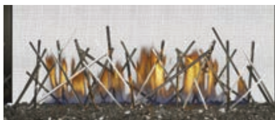
Bâtonnets décoratifs plaqués nickel