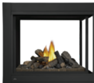
Péninsule (3 côtés)