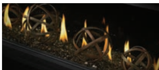
Globes en fer forgé