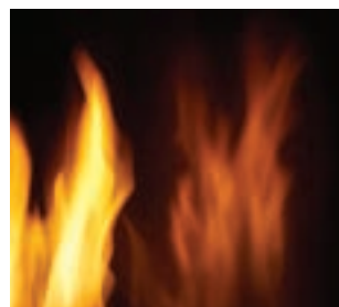
Panneaux réflecteurs radiants en porcelaine MIRO-FLAMME™