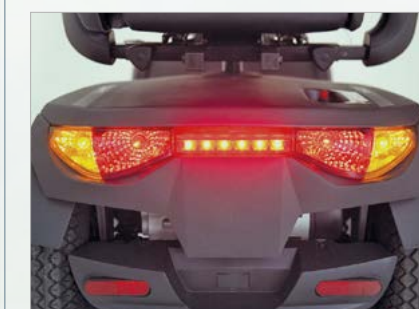
Éclairage de haute qualité