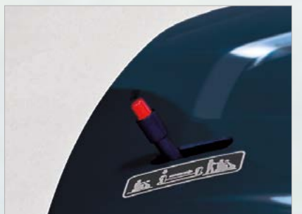
Levier de débrayage à deux niveaux pour éviter la roue libre