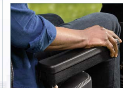
Accoudoir réglable en hauteur et en largeur