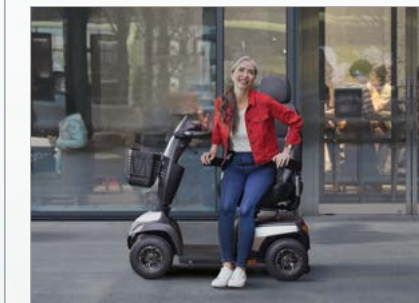
Siège pivotant pour faciliter le transfert