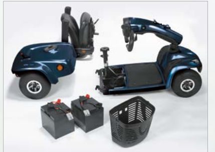
Facile à transporter dans votre voiture