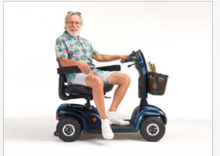
Siège pivotant pour un transfert facile