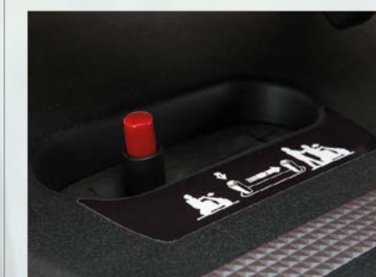
Levier de débrayage à deux niveaux pour éviter la roue libre