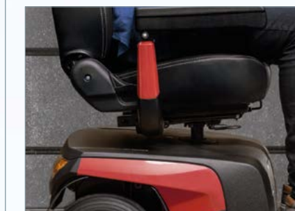
Colonne d'assise renforcée