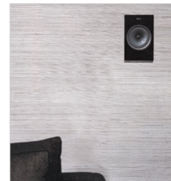
R8a an der Wand