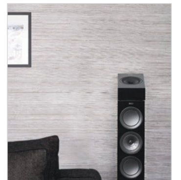
R8a als Aufsatzlautsprecher