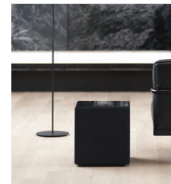
KEF stellt eine Subwoofer-Serie her, die die R-Serie mit einem kräftigen und kontrollierten Bass unterstützt.