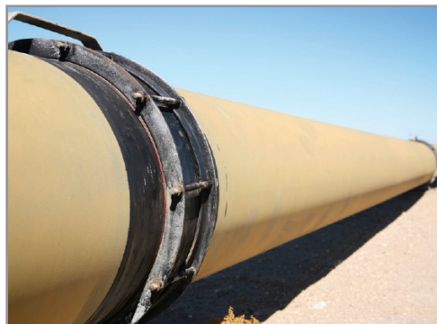
Application du ruban sur pipeline de pétrole.

Personne n'a reçu d'autorisation de notre part de donner des garanties verbales. Nous nous réservons le droit d'effectuer des changements sans préavis.