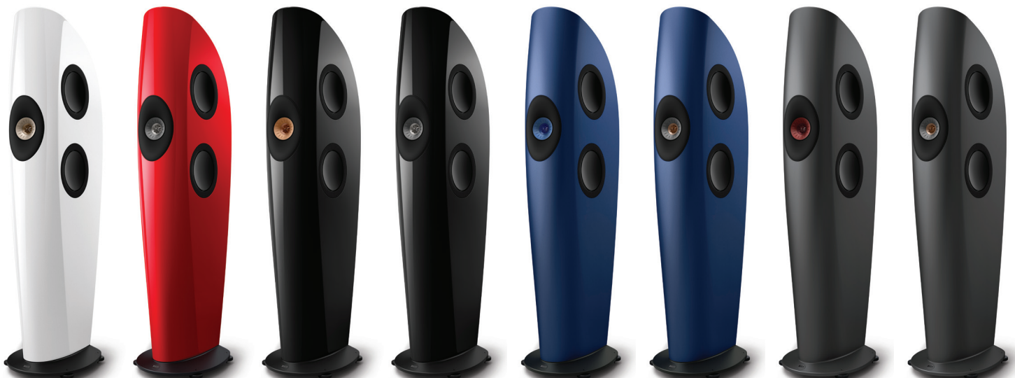
Arctic White/ Champagne

Mit der Philosophie der Innovation im Streben nach dem genauesten und realistischsten Klang geht es bei Blade um die Perfektionierung eines bahnbrechenden Konzepts, und die Begeisterung der Zuhörer durch ein ultimatives Hörerlebnis.