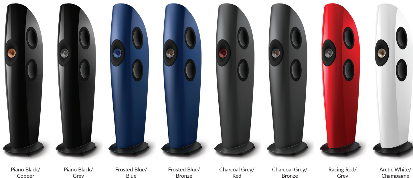
Piano Black/ Copper

Mit der Philosophie der Innovation im Streben nach dem genauesten und realistischsten Klang geht es bei Blade um die Perfektionierung eines bahnbrechenden Konzepts, und die Begeisterung der Zuhörer durch ein ultimatives Hörerlebnis.