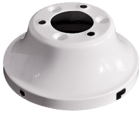
Low Ceiling Adapter