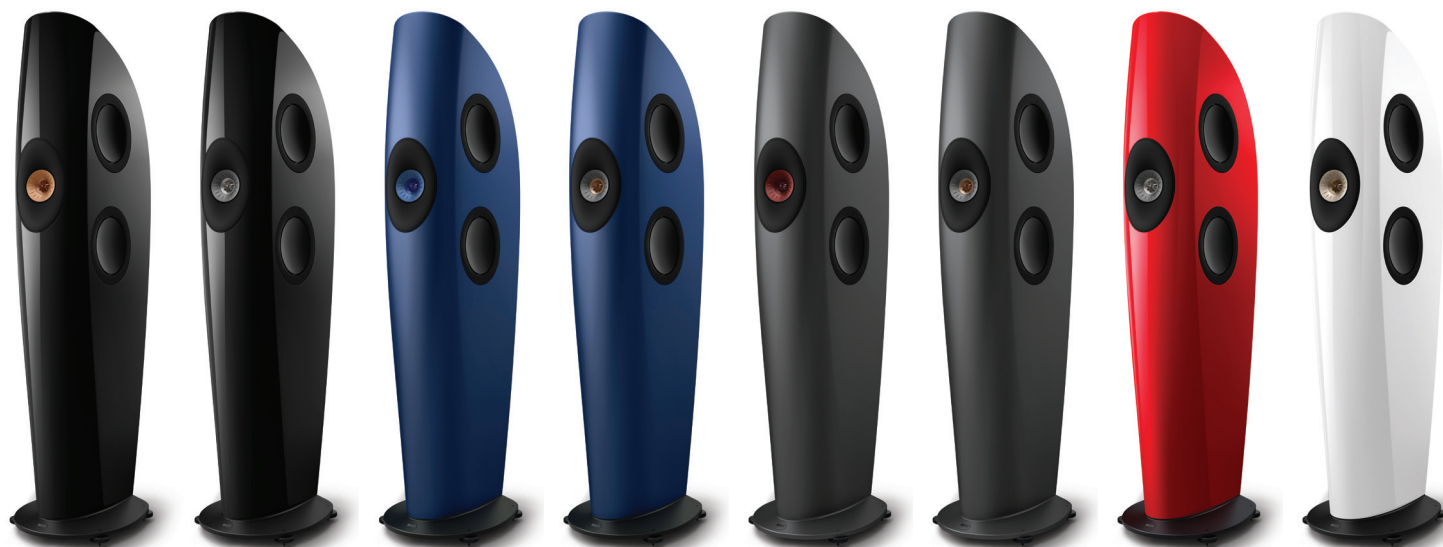
Piano Black/ Copper